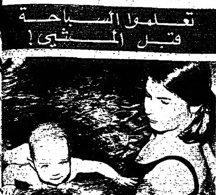
حتى الأطفال يسبحون... هذا ما يهتم به مدرسة الرياضة الاولية...